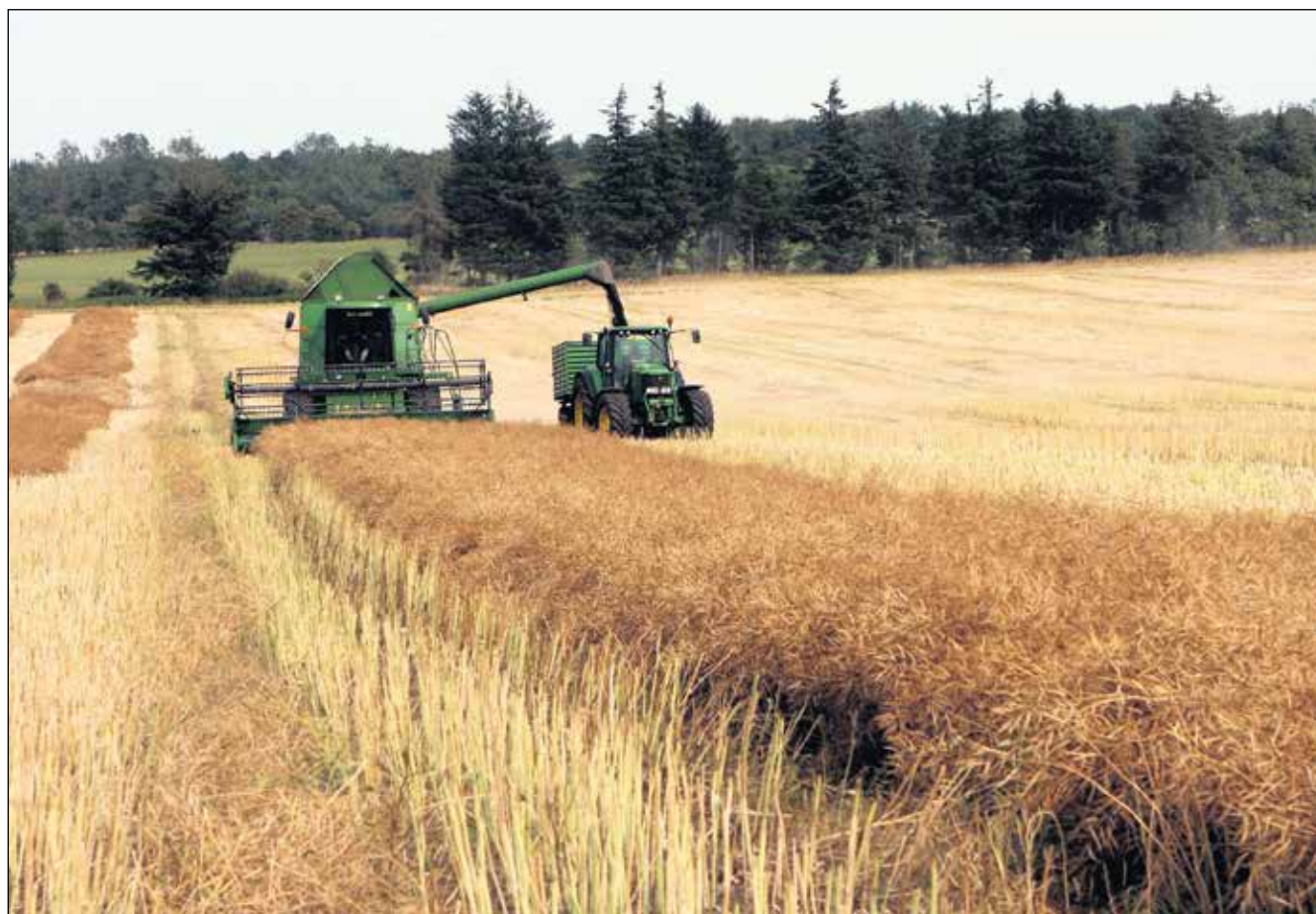
Rapsen lægges ud på et fire meter bredt skår for optimal tørring. Tærskningen blev udført i onsdags og forløb uproblematisk med en vandprocent på 8,5.

- Det er femte i træk, vi vælger at få skårlagt raps af Brøderene Dahl – og igen impone-